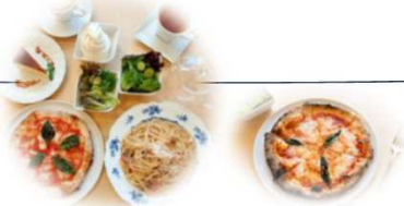
食事の写真はイメージです